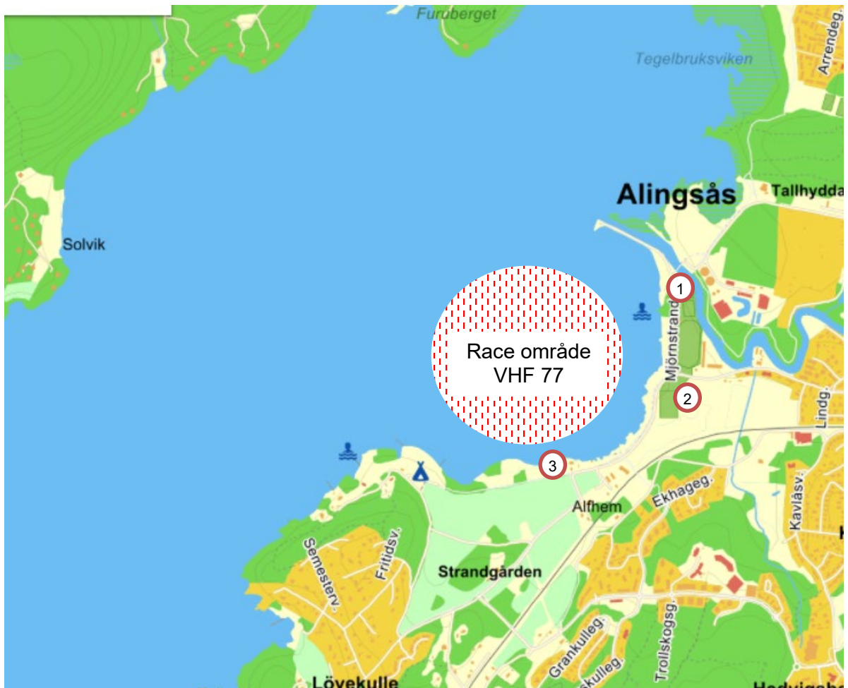
1. Sjösättning följebåt