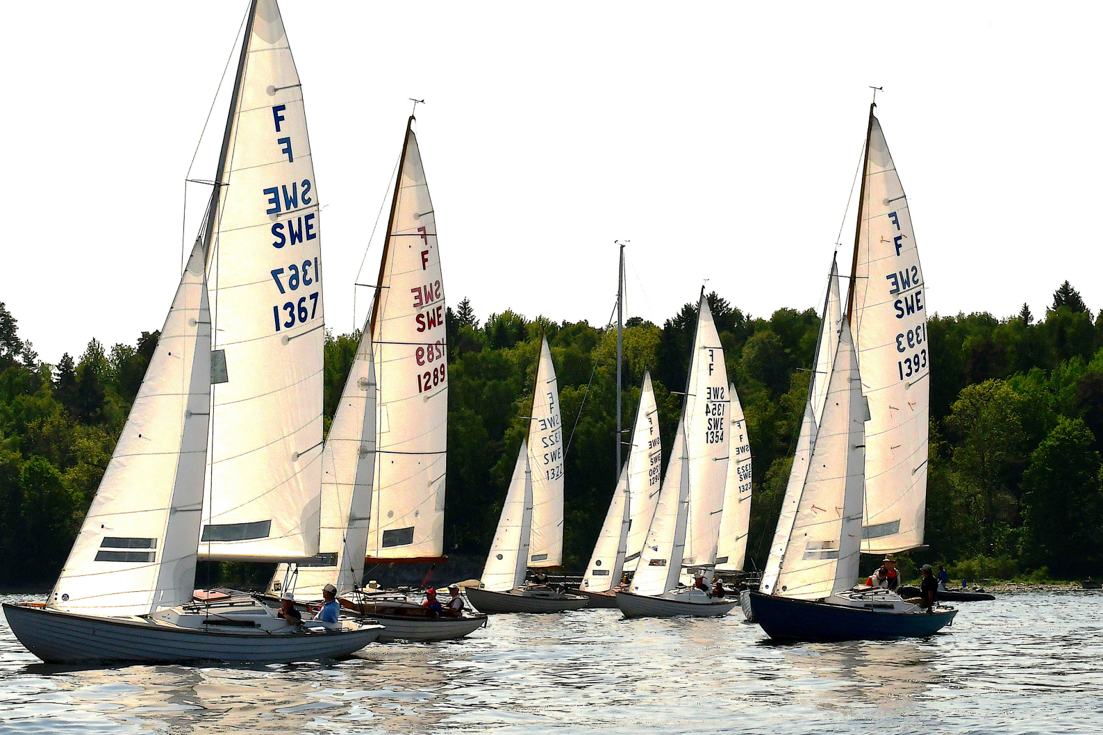
Vikingaregattan 2024